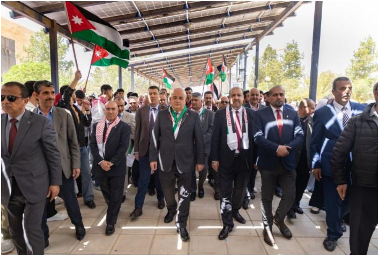
الجامعة الهاشمية تجدد العهد في يوم العلم في احتفالٍ وطنيٍّ جسد معاني الانتماء والمسؤولية

الكاتب ع الصياد الاخباري سباي سات الخميس 16 أبريل 2026 3 دقيقة قراءة